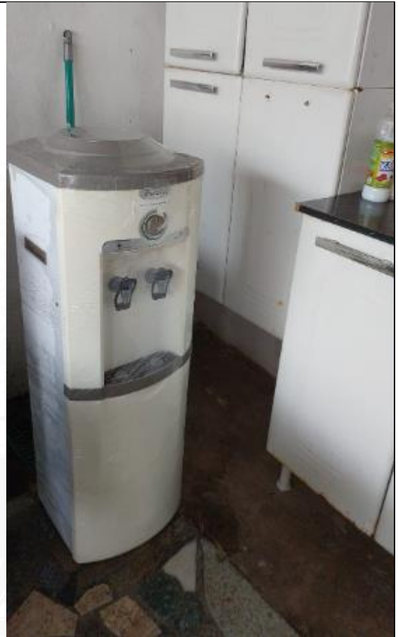
Figura 3 - Bebedouro higienizado pronto para uso instalado na Loja